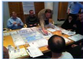
Planspiel „On Board – Passenger Management“