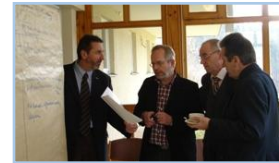
Teilnehmer beim Erarbeiten von Ergebnissen

Impressionen aus durchgeführten spezifischen Aviation-Management-Seminaren