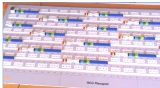
Spielplan: On Time – Ramp Handling

5 Business Game „On Time – Ramp Handling“