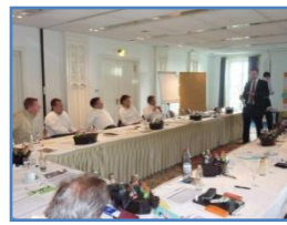
Vermittlung des theoretischen Wissens

Impressionen aus durchgeführten spezifischen Aviation-Management-Seminaren